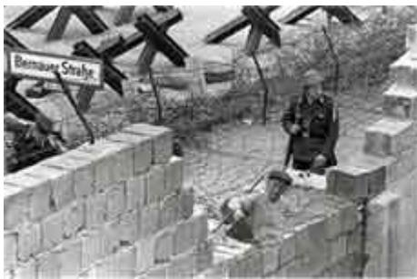
agosto 1961 costruzione del muro recupero del corpo di Peter Fechter

L. 15 aprile 2005, n.61 (in GU 26 aprile 2005, n.95)