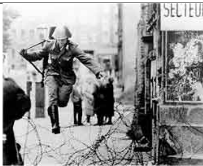
fuga di un "vopos" da Berlino est (18 anni) ucciso dai