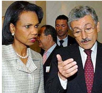
Massimo si chiarisce