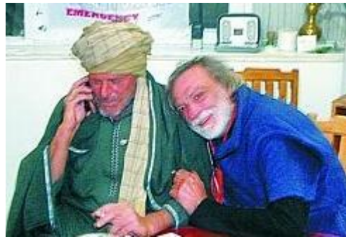
Il sorriso di Strada