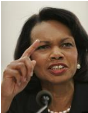
La rabbia di Condoleezza per l'ignominiosa resa con l'arrabbiata Rice